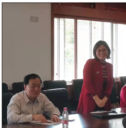
(四位新任院级教学督导分别作自我介绍)