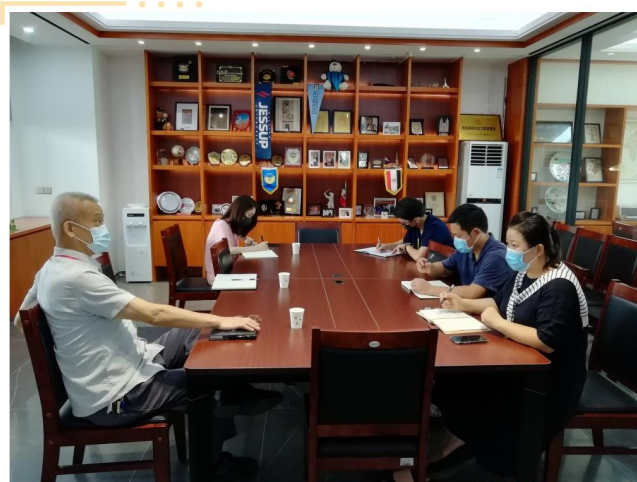
调研组在国际学院交流座谈

目前国际学院有 27 位学生组成的教学班，进行小班教学，请经济学院、管理学院、旅游学院的教师用全英教学或双语教学的方式讲授专业课程，学风、班风良好，学生的学习主动积极。