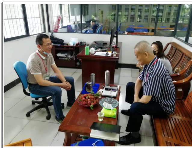
调研组在信息科技学院交流座谈