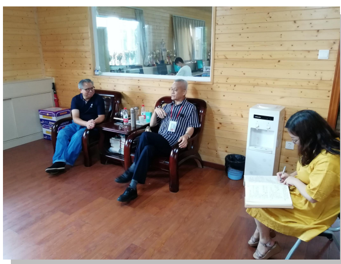
调研组在经济学院交流座谈