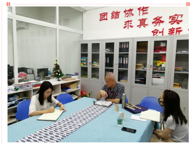
调研组在教育学院交流座谈