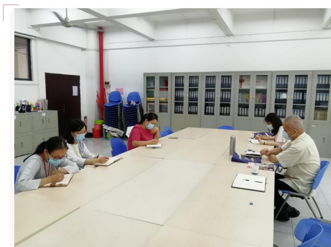
调研组在东语学院交流座谈

制订了详细的指标体系，对毕业论文指导、教改研究、调停课都有详细的规定，保障教学质量。