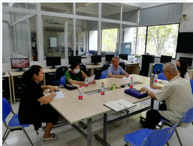
调研组在英文学院交流座谈