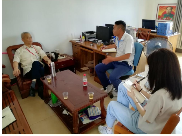
调研组在体育部交流座谈