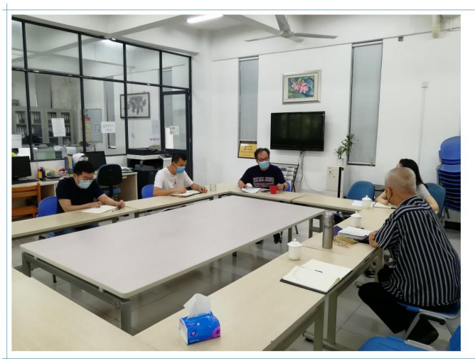
调研组在西语学院交流座谈

3. 同类型课的集体备课。比如《基础德语 I、II》、高年级的笔译、口译课程等。