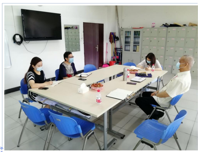
调研组在大英部交流座谈