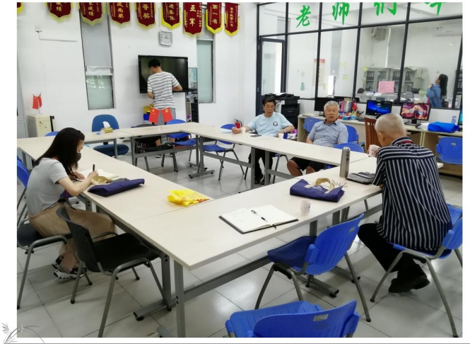
调研组在中文学院交流座谈